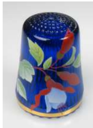
1152651 Glas blau