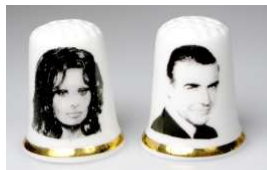
Oben: Schauspieler Sophia Loren und Sean Connery, Name hinten, Porzellan, England 1132618 Sophia Loren 1132619 Sean Connery