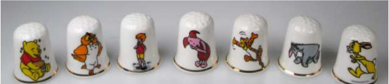
1132609 Winnie Puh (7-Set)

Winnie Puuh oder englisch Winnie the Pooh ist ein englisches Kinderbuch des Autors Alan Alexander Milne. Darauf basieren die Zeichentrickfilme und Serien von Walt Disney. Winnie Puuh findet man als Stofftier, es gibt ihn auf Kleidungsstücken, als Kinderbuch und Hörspiel. Bekleidet wird er von seinen Freunden. So auch auf diesen englischen Fingerhüten. Diese sind im 7-Set erhältlich.