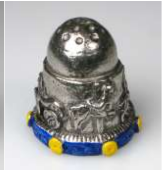
Aluminium Reklame R.V.S. Levensv. MY ca 1920 Messing geschwärzt Stephansdom um 1900 Settmacher Zinn England Dach und unterer Rand handbemalt Fingerhut mit Karussellpferdchen (2. Bild) Dach abnehmbar