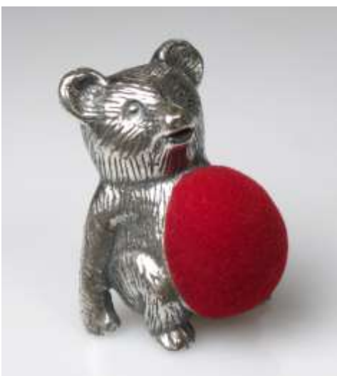
Nadelkissen Bär, Silber, ca 3 cm, England. 1132620 Nadelkissen Bär