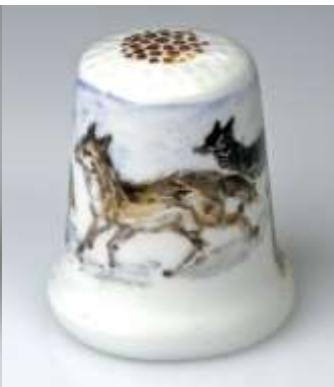
1132615 Wolf 1132616 Elch Hösch 1132617 Höchst 2005