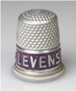
1132612 Levens 1132613 Stephansdom 1132614 Karussell

Für alle Fingerhüte auf dieser Seite gilt: Lieferung solange Vorrat reicht!